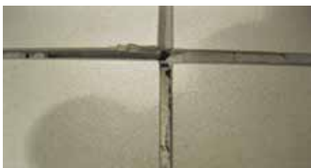
Obr. 3: Čím menší velikosti dlaždic, tím větší je počet dlaždic a spár, které přicházejí do styku s dráhou koleček. Obrázek ukazuje příklad „poškozených dlaždic“ a „vypadlé“ malty ze spár.

V tom případě je výhodné, aby projektant, zhotovitel, stavební dozor atd. měli informace o výsledku testu, resp. o vhodnosti daného souvrství pro předpokládané zatížení podlahy.