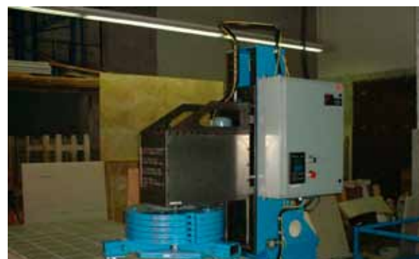
Obr. 1c: Varianta zařízení ve zkušebně Terazzo, Tile et. Marble Association of Canada