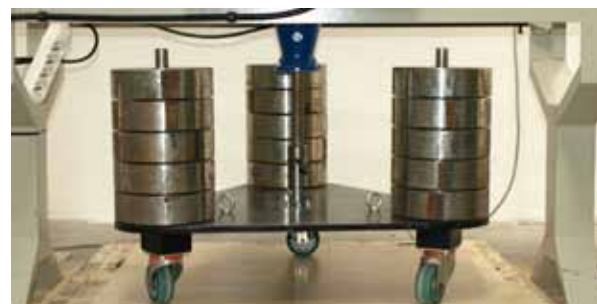
Obr. 1b: Konstrukčně vylepšený model zkušebního zařízení od firmy Steelker, S.r.l. (Itálie)