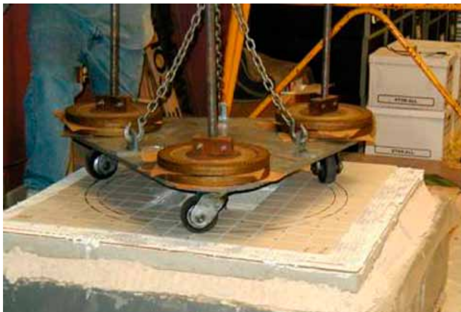
Obr. 2: Stav zkušební vzorku po provedení 12 cyklů. Když vozík dokončil 450 otáček, zkušební vzorek se podrobí vizuálnímu zkoušení s cílem zjistit, zda 13. cyklus bude zahájen.